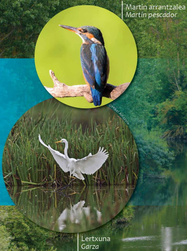
Martin arrantzalea Martín pescador

La relación entre las personas y el agua también es notable a lo largo del cauce, y ejemplo de ello son los molinos y los puentes situados a orillas del río.