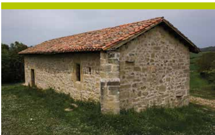
Ermita de Nuestra Señora del Lago.

A tener en cuenta: Iniciamos un tramo de cierta dificultad que bordea el lago de Caicedo Yuso-Arreo. Si quieres evitar este tramo, toma el camino de la izquierda y volverás a conectar con esta ruta en el punto kilométrico 4,6.