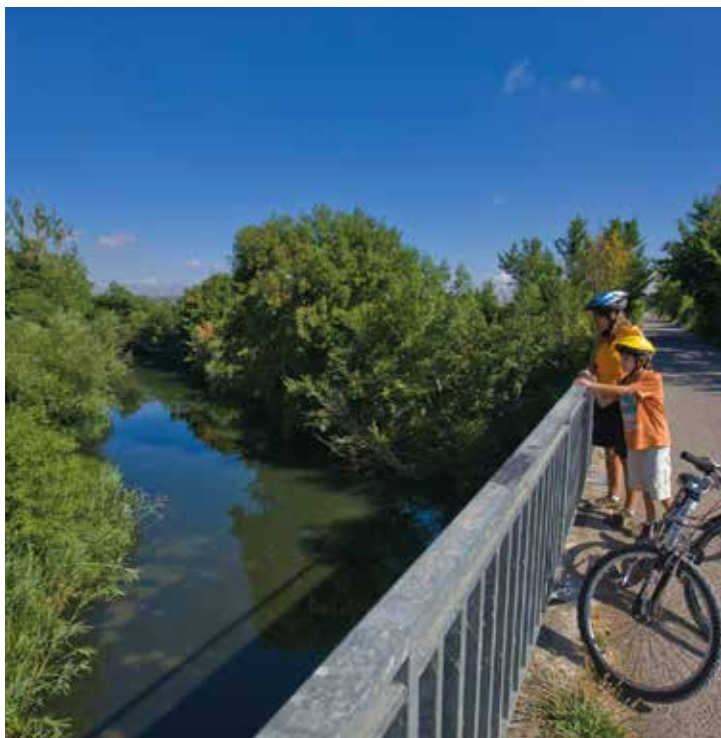
Zadorra ibaiko zubia.

Abialekua Gamarrako kiroldegiko aparkalekua da, Gasteizko eraztun berdean dagoen Zadorrako parketik hurbil