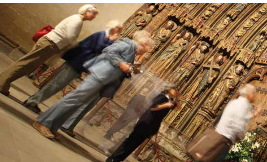
Erregeen Santa Maria (Guardia).

Ezkerreko bira egingo dugu pista batetik eta gero, berehala, eskuinera, GRko markei jarraiki.