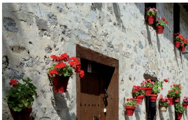
Subijana de Álava